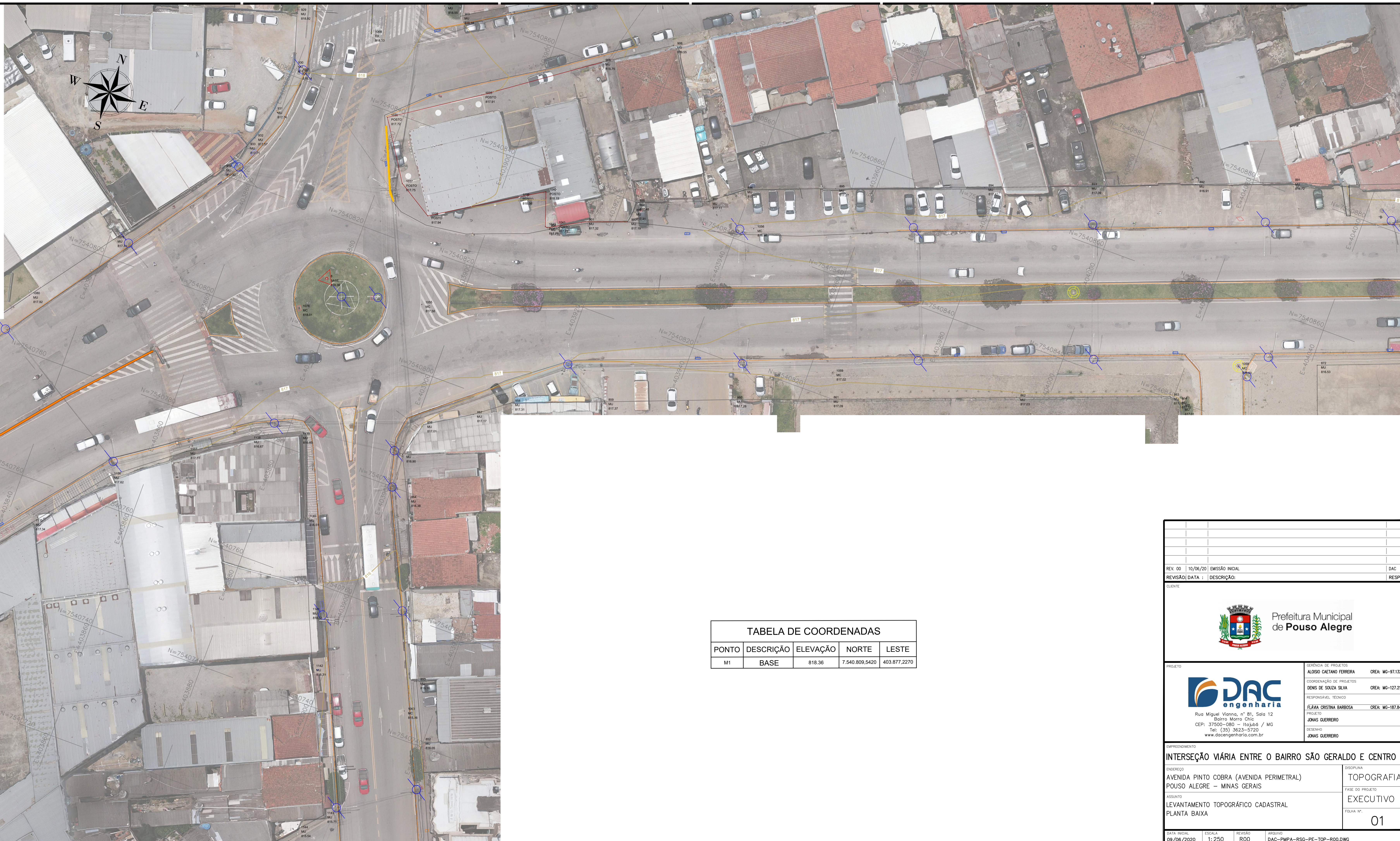
LEVANTAMENTO TOPOGRÁFICO CADASTRAL - PLANTA BAIXA ESCALA 1:250